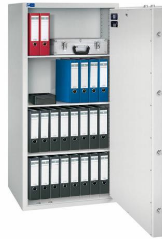
Modell TOPAS 1600/7 Außen: H 1600/B 750/T 600 mm Innen: H 1500/B 650/T 470 mm Fachböden: 3 Ordner A4: 32 Volumen: 458 Liter Gewicht: 380 kg