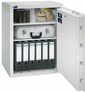
Modell TOPAS 800/6 Außen: H 800/B 600/T 500 mm Innen: H 700/B 500/T 370 mm Fachböden: 1 Ordner A4: 6 Volumen: 130 Liter Gewicht: 170 kg