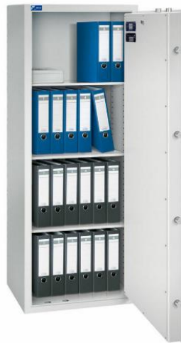
Modell TOPAS 1600/6 Außen: H 1600/B 600/T 500 mm Innen: H 1500/B 500/T 370 mm Fachböden: 3 Ordner A4: 24 Volumen: 278 Liter Gewicht: 296 kg