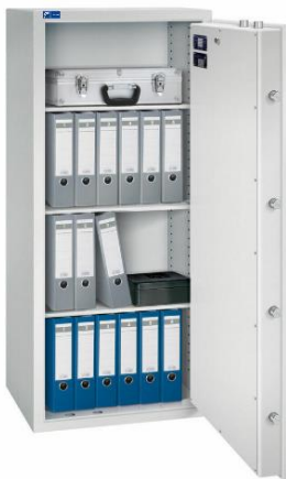
Modell TOPAS 1400/6 Außen: H 1400/B 600/T 500 mm Innen: H 1300/B 500/T 370 mm Fachböden: 3 Ordner A4: 18 Volumen: 240 Liter Gewicht: 265 kg