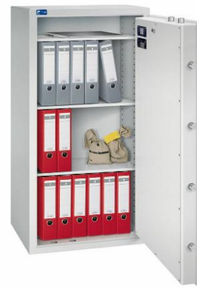
Modell TOPAS 1200/6 Außen: H 1200/B 600/T 500 mm Innen: H 1100/B 500/T 370 mm Fachböden: 3 Ordner A4: 18 Volumen: 204 Liter Gewicht: 234 kg