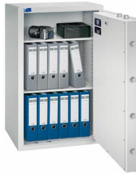
Modell TOPAS 1000/6 Außen: H 1000/B 600/T 500 mm Innen: H 900/B 500/T 370 mm Fachböden: 2 Ordner A4: 12 Volumen: 167 Liter Gewicht: 200 kg