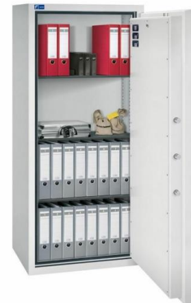
Modell GOLD PRO 6 Außen: H 1850/B 795/T 600 mm Innen: H 1704/B 650/T 392 mm Fachböden: 3 Ordner A4: 32 Volumen: 434 Liter Gewicht: 700 kg