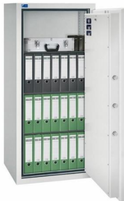
Modell GOLD PRO 5 Außen: H 1600/B 710/T 600 mm Innen: H 1454/B 565/T 392 mm Fachböden: 3 Ordner A4: 21 Volumen: 322 Liter Gewicht: 660 kg