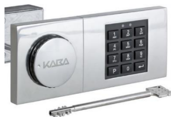
Elektronischschloss CCB30 1 Mastercode bis zu 80 Benutzercodes mit 1 Notschlüssel EMA-fähig (Zubehör erforderlich) Schlossklasse 2