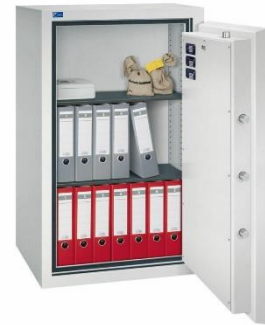
Modell GOLD PRO 3 Außen: H 1200/B 710/T 600 mm Innen: H 1054/B 565/T 392 mm Fachböden: 2 Ordner A4: 14 Volumen: 233 Liter Gewicht: 430 kg