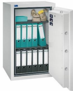
Modell GOLD PRO 2 Außen: H 1050/B 625/T 600 mm Innen: H 904/B 480/T 392 mm Fachböden: 2 Ordner A4: 12 Volumen: 170 Liter Gewicht: 350 kg