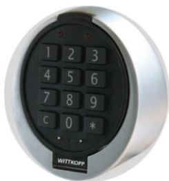
Elektronischschloss PRIMOR 1 Master- 1 Benutzercode ohne Notschlüssel Schlossklasse 2