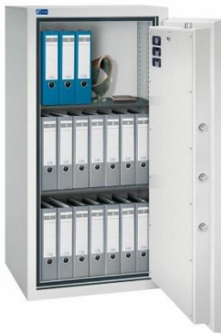
Modell GOLD PRO 4 Außen: H 1450/B 710/T 600 mm Innen: H 1304/B 565/T 392 mm Fachböden: 2 Ordner A4: 21 Volumen: 288 Liter Gewicht: 570 kg