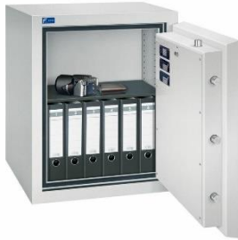
Modell GOLD PRO 1 Außen: H 800/B 625/T 600 mm Innen: H 654/B 480/T 392 mm Fachböden: 1 Ordner A4: 6 Volumen: 123 Liter Gewicht: 300 kg