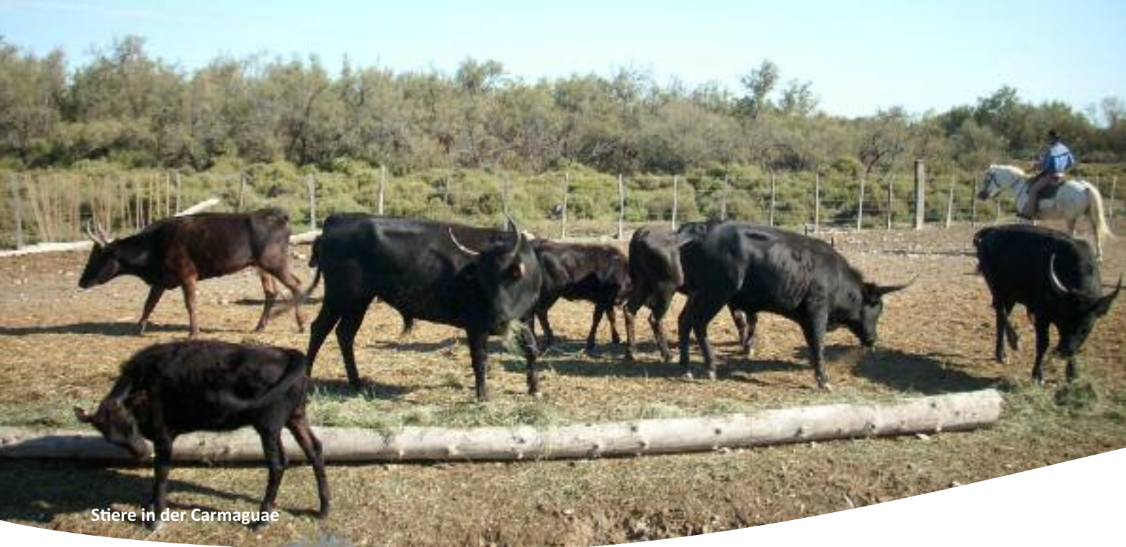
Stiere in der Camargue

chermagnete wie das Horreum, ein unterirdisches Labyrinth aus alten Lagerhäusern individuell besuchen und den Flair der Stadt genießen können.