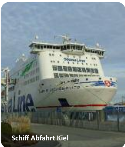
Schiff Abfahrt Kiel

Elchsafari mit Besuch des Jagdmuseums, inkl. Snack am Lagerfeuer 39,- €