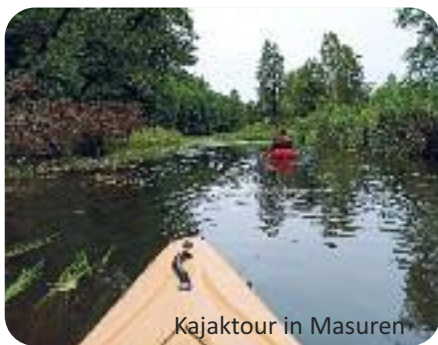
Kajaktour in Masuren

Der Bus bringt uns heute nach Kruttinnen. Der frühere Kurort ist bekannt für die Kajak- und Bootsfahrten auf dem wunderschönen Flüschen Krutinna . Auch wir lassen uns flussaufwärts staken. Wir besuchen den örtlichen Friedhof , der 2021 von Studenten aus Düsseldorf und Olsztyn/Allenstein im Rahmen des Projektes „Vergessene Friedhöfe“ bearbeitet wurde. Gelegenheit zum Mittagessen in Kruttinnen. Mit dem Bus fahren wir nach Wojnowo und besuchen das Kloster der