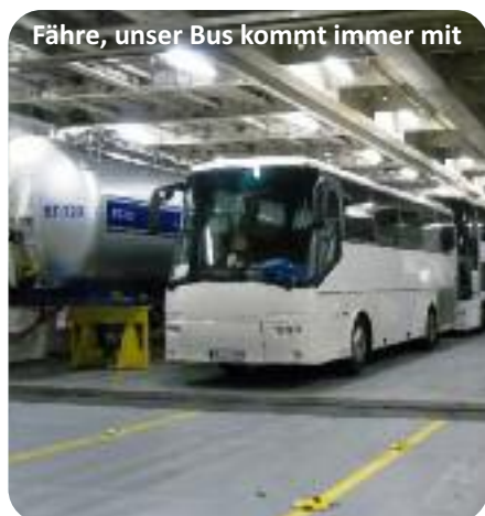
Fähre, unser Bus kommt immer mit

Von unserem Standorthotel fahren wir am späten Vormittag los. Heute wollen wir uns die Region Cotswolds ansehen. Zunächst besuchen wir Blenheim Palace , den Geburtsort von Winston Churchill. Danach geht es nach Stratford upon Avon . Dort ist zunächst die Shakespeare Gin Distillery unser Ziel. Nach einer Führung können Sie einige Kostproben probieren. Danach Zeit zur eigenen Erkun-