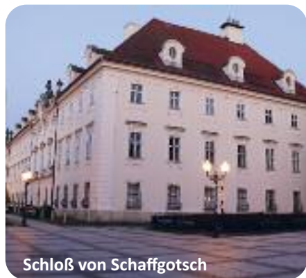
Schloß von Schaffgotsch

Die Ankunft in Erkrath/ Düsseldorf ist am frühen Abend.