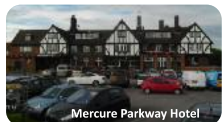
Mercure Parkway Hotel

Es gelten die AGB von Neandertours Veranstalter: Neandertours Erkrath, Bahnstraße 6, 40699 Erkrath