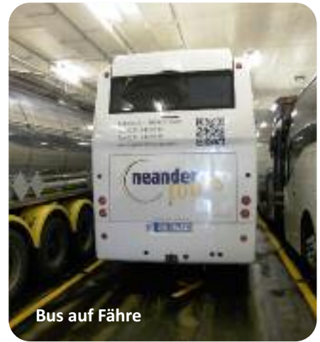
Bus auf Fähre

Paradies für Wasservögel, die Sie vielleicht während der Fahrt beobachten können. Durch den Naturpark Tiveden geht es dann hinüber zum größten See Schwedens. Er ist 10 x so groß wie der Bodensee und drittgrößter See Europas. Unser Ziel ist das kleine Städtchen Lidköping an der Seebucht Kinnevik. Die Stadt ist landesweit für die Porzellan-Manufaktur Rörstrand bekannt. Mitten in der Altstadt liegt das rote Jagdschlösschen mit seiner riesigen Dachhaube. Ungewöhnlich ist die große Auswahl an Kaffeehäusern. Allein in der Innenstadt zählt man 15 verführerische Cafés.