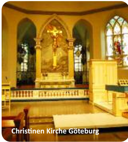
Christinen Kirche Göteborg