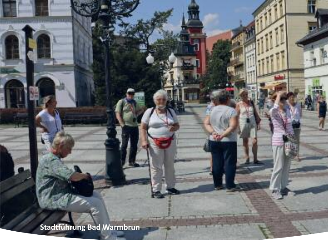
Stadtführung Bad Warmbrunn