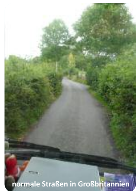
normale Straßen in Großbritannien