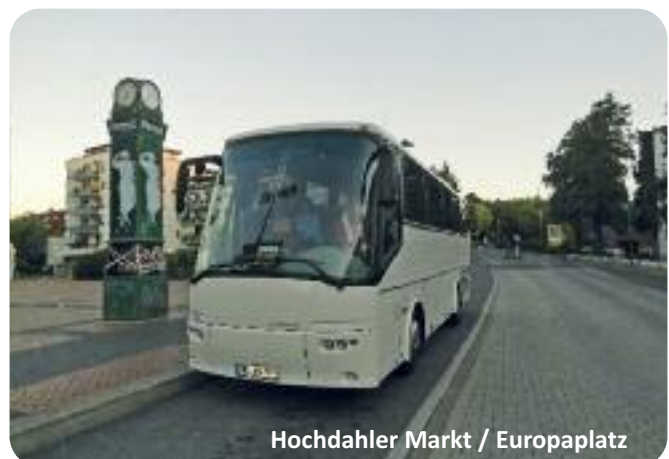
Hochdähler Markt / Europaplatz

(1) Taxitransfer gegen Aufpreis 30,00 EUR / Person Hin und zurück aus Hilden, Haan, Ratingen und Mettmann