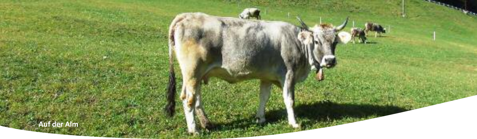
Auf der Alm