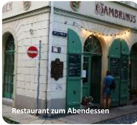
Restaurant zum Abendessen