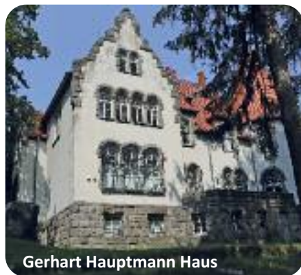
Gerhart Hauptmann Haus