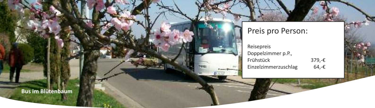
Bus im Blütenbaum