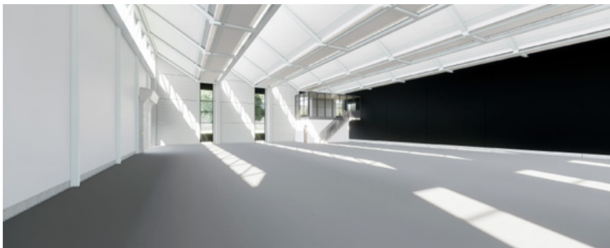
Abbildung 2:

Produktionshallen zur Weiterentwicklung und Herstellung von Glasfaserbewehrung für verschiedene Produkte der Schöck AG.