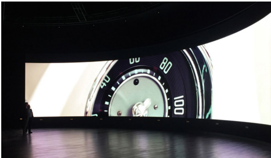
Abbildung 8: Copr. Morese Architekten, 2015

Eine gewölbte LED-Bildwand und ein auf Wellenfeldsynthese basierender Raumsound ermöglichen ein immersives Hör- und Seherlebnis in der Autostadt, dem Auslieferungszentrum für Neuwagen der Volkswagen AG, in unmittelbarer Nähe des Volkswagenwerks.