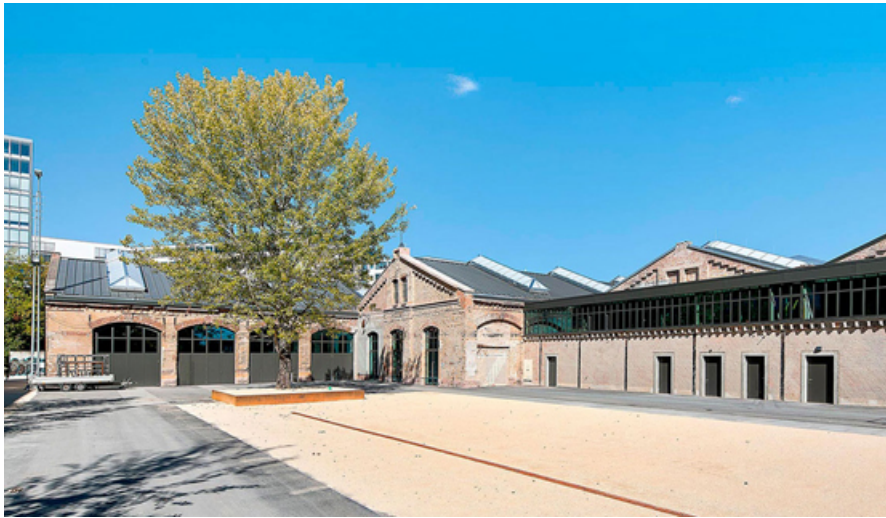
Abbildung 5: Copr. Marco Gernt Architekten, 2018

Neuer Look mit altem Charme: Sanierung, Umbau und Erweiterung einer ehemaligen Lokomotiv-Remise