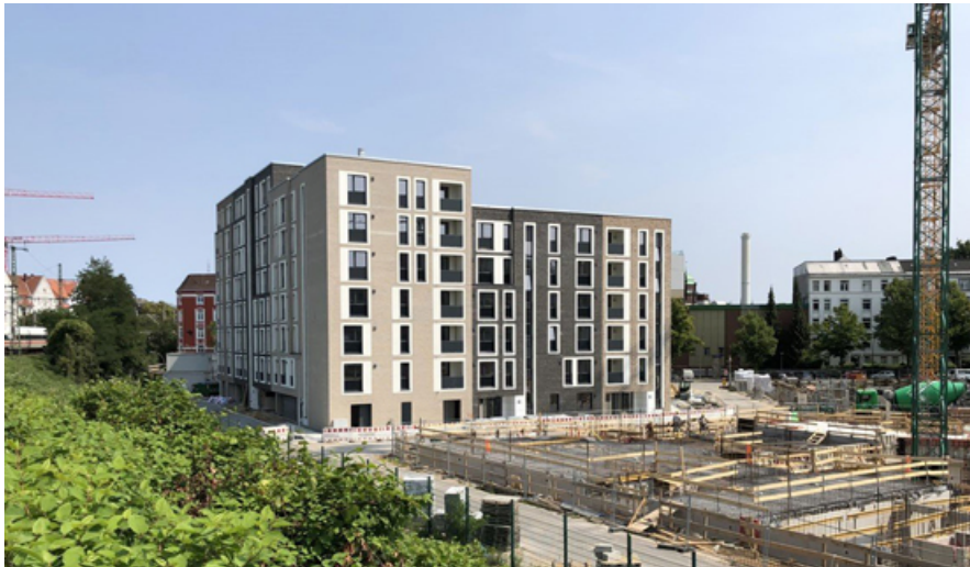
Abbildung 7:

Neubau von - Neubau für zwei Genossenschaften mit NutzerInnenbeteiligung, ca. 3.100 qm Wohnfläche.