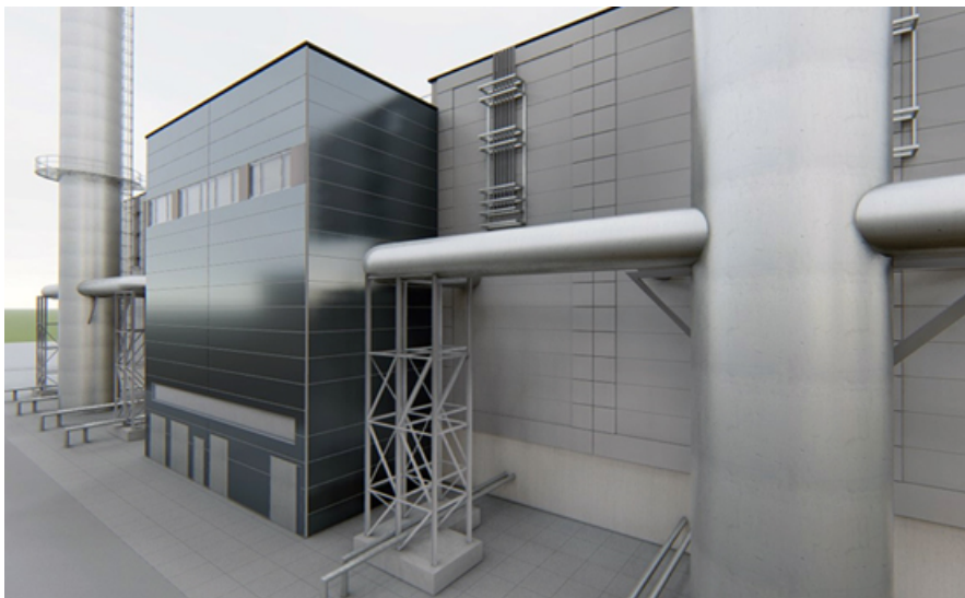
Abbildung 3: Copr. ARCUS Planung + Beratung, 2019

Anlage zur Bereitstellung von Wärme und Strom aus Gasmotoren, zur Flexibilisierung des Erzeugerarks und zur Teilnahme am Regelenergie-Markt.