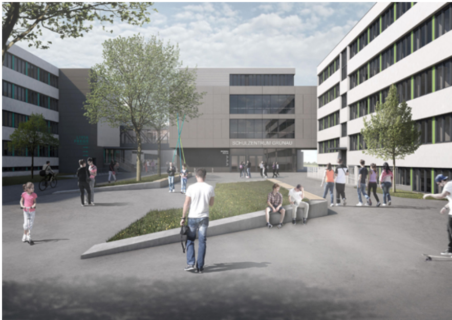
Abbildung 1:

Das Schulzentrum bietet nach seiner Fertigstellung Platz für den Unterricht von rund 2.400 Schülern.