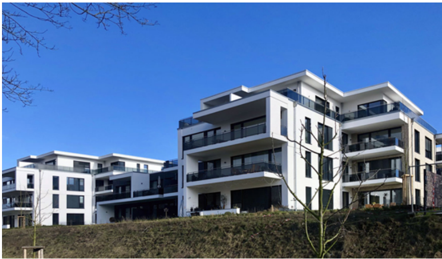
Abbildung 6: Copr. Marco Gernt Architekten, 2018

Exklusiver Wohnraum in Lüneburgs neuer Bestlage. Es handelt sich um 28 Eigentumswohnungen mit insgesamt ca. 3.000 qm Wohnfläche.