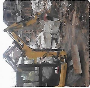
Abbruch- und Transportarbeiten