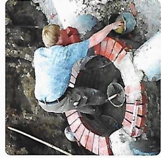
Kanal- und Brunnenbau