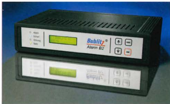
Eine Steckdose reicht und die Anlage ist betriebsbereit - kein Dreck, kein Lärm.