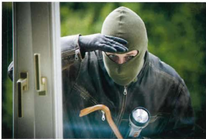
Kann jedem zum Albtraum werden: Ein Einbruch!

Die kinderleichte Bedienung, die auch per Handy-App möglich ist, begeistert. Umfangreiche Erweiterungsmöglichkeiten z.B. mittels Rauch- oder Wassermeldern oder die Möglichkeit der Absicherung von abge-