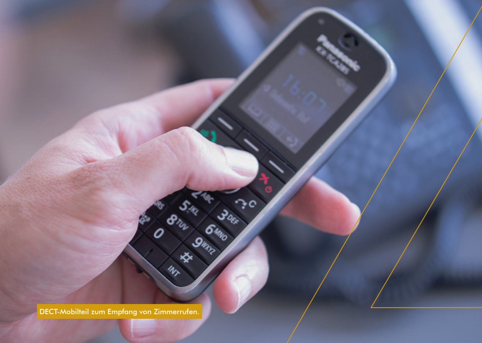
DECT-Mobilteil zum Empfang von Zimmerrufen.