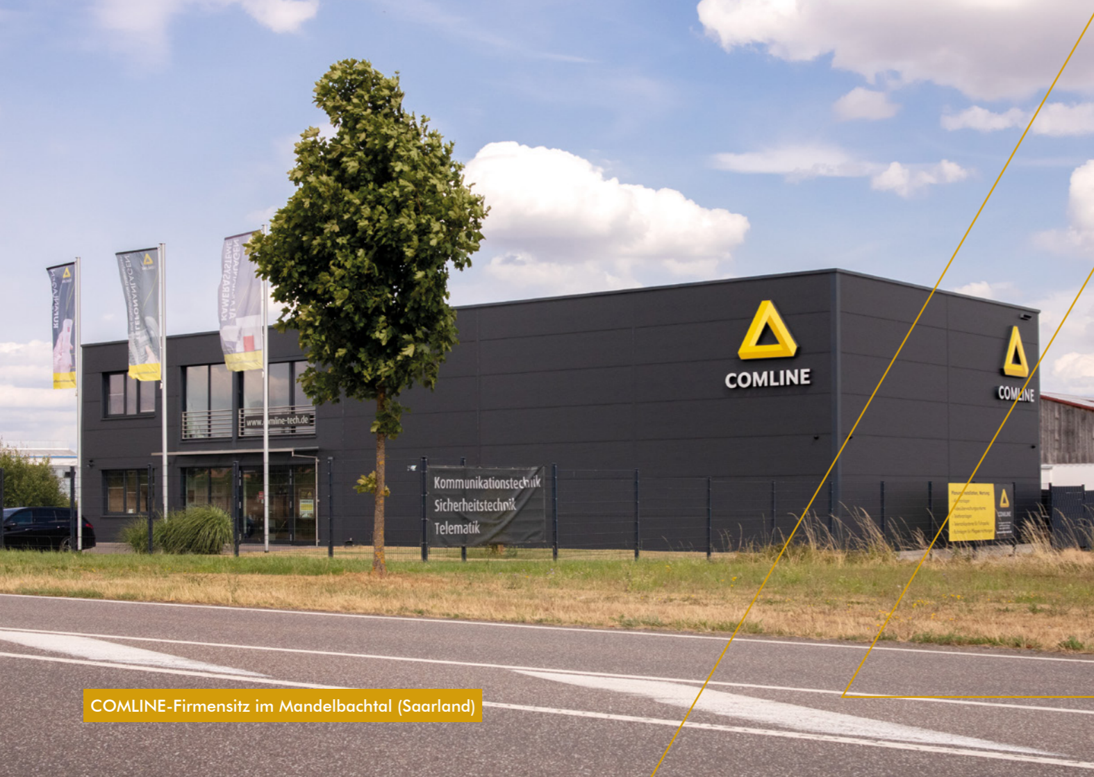
COMLINE-Firmensitz im Mandelbachtal (Saarland)