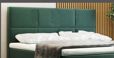
Kopfteil Paris Kopfteil mit 6 Felder