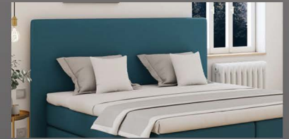
Schlichtes, schlankes Kopfteil mit Keder seitlich