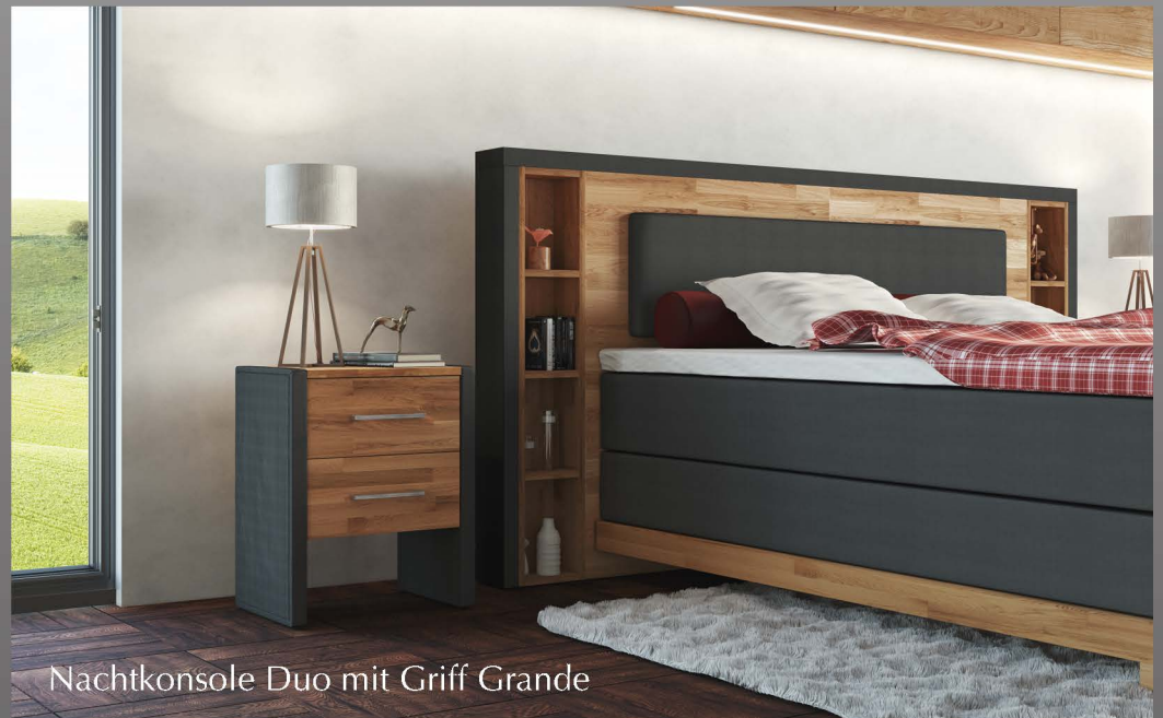
Nachtkonsole Duo mit Griff Grande