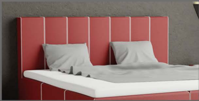
Kopfteil Bremen Schlichtes Kopfteil mit Ziernähten