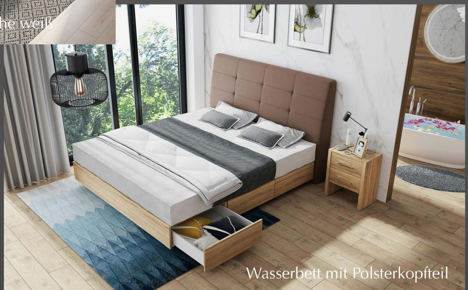
Wasserbett mit Polsterkopfteil