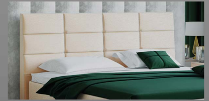
Abgeschrägtes Kopfteil mit Bisen