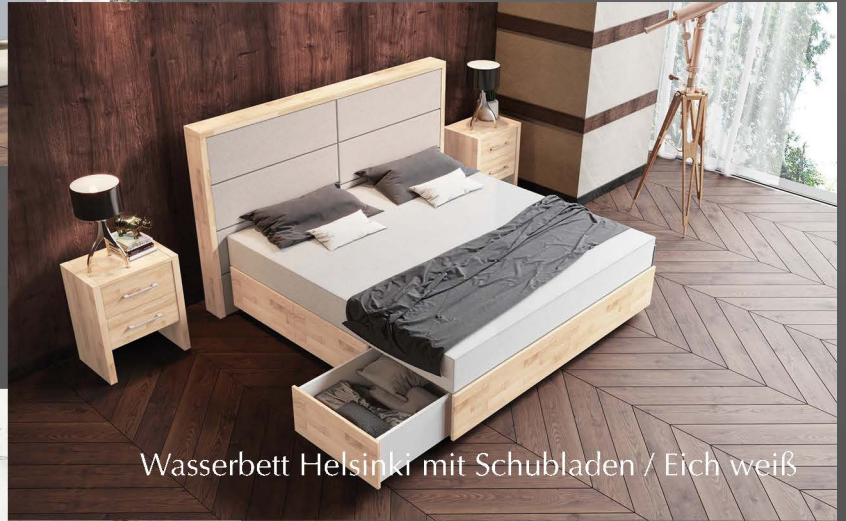
Wasserbett Helsinki mit Schubladen / Eich weiß