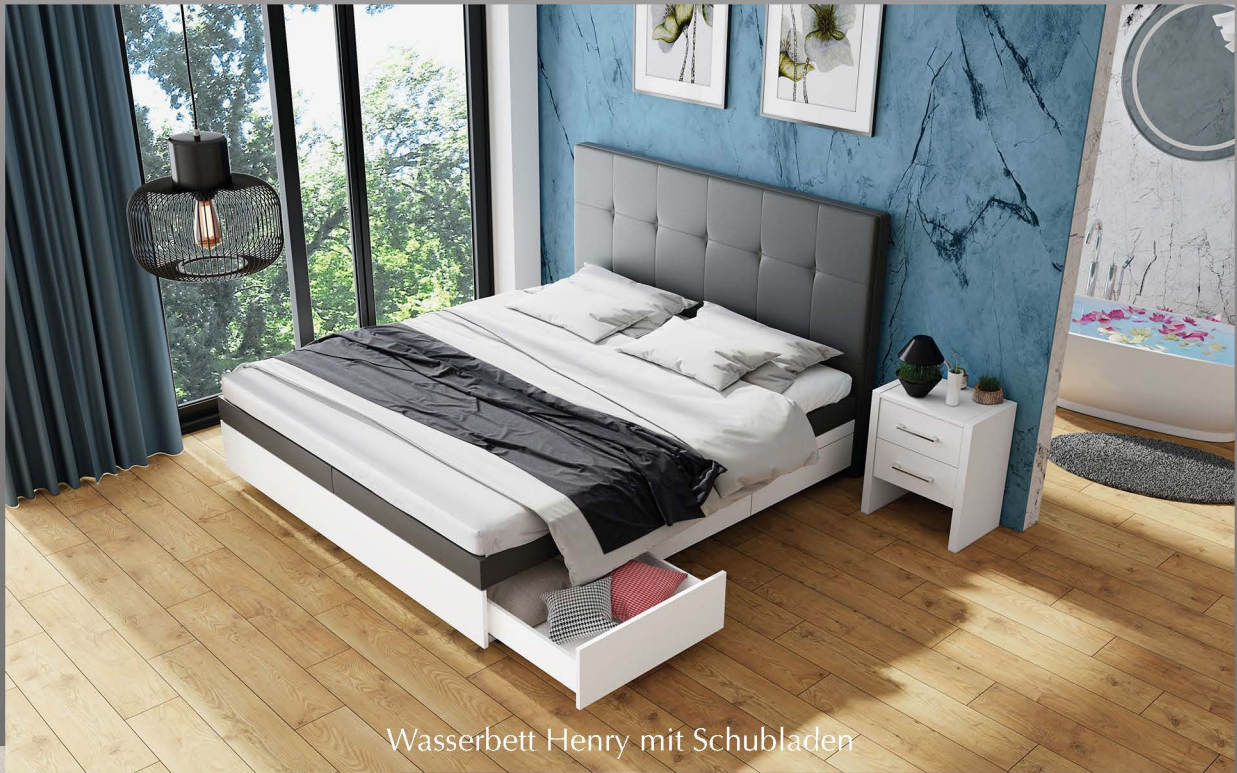
Wasserbett Henry mit Schubladen