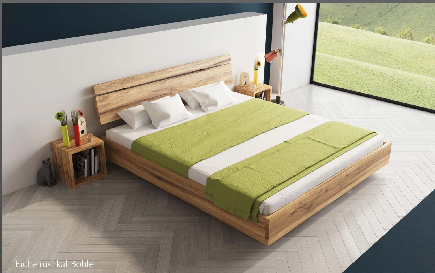
Eiche rustikal Bohle

Erhältlich als: Wasserbett Boxspringbett