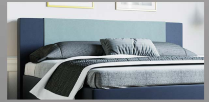
Schlichtes Kopfteil mit Kissen