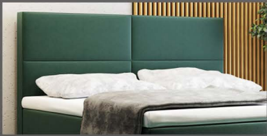
Kopfteil Berlin Kopfteil mit 4 Felder