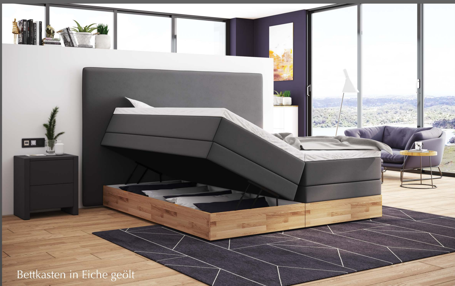
Bettkasten in Eiche geölt