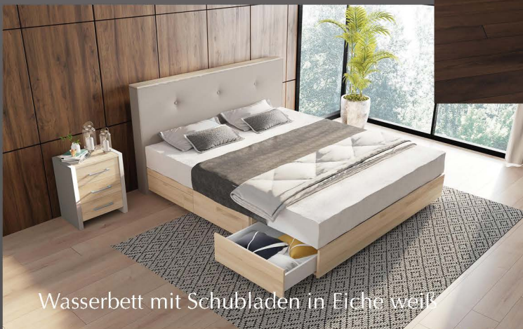
Wasserbett mit Schubladen in Eiche weiß