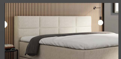
Kopfteil mit Feldern