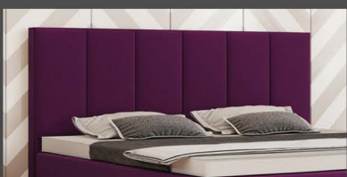
Kopfteil Rostock Kopfteil mit vertikalen Nähten