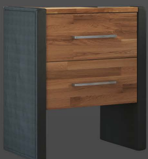
Nachtkonsole DUO mit 2 Schubladen

Deckel: In Stoff oder Holz Korpus: In Stoff oder Holz