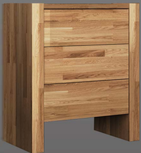
Nachtkonsole Primera mit 3 Schubladen

Wangen: Massivholz Schübe: Massivholz Griff: Push to open (ohne Griff)