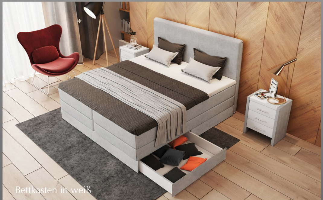
Bettkasten in weiß

Genießen Sie den Komfort eines richtigen Boxspringbett und verzichten dabei nicht auf den oft wichtigen Stauraum. Fast jedes Boxspringbett ist auch mit Schubladen in Stoff, Holz oder Dekor erhältlich.