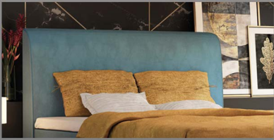
Kopfteil Köln Schlichtes leicht geschwungenes Kopfteil