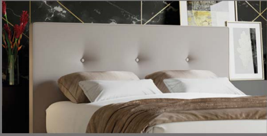
Kopfteil Koblenz Schlichtes Kopfteil mit Knöpfen