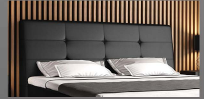
Abgeschrägtes Kopfteil mit Kapnaht