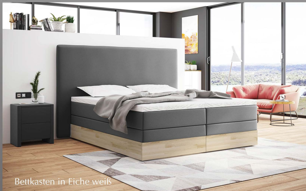
Bettkasten in Eiche weiß

Machen Sie es sich bequem im Boxspringbett mit Bettkasten. Dieser ist in Stoff, Holz oder Hochglanz erhältlich. Genießen Sie den perfekten Schlafkomfort auf einem Boxspringbett der Extraklasse mit hochwertigen Matratzen und Toppfern.