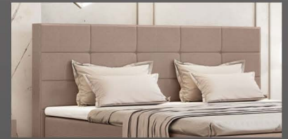
Kopfteil mit Feldern und Bisen