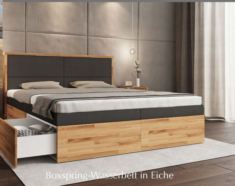
Boxspring-Wasserbett in Eiche