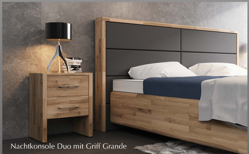
Nachtkonsole Duo mit Griff Grande

Holz strahlt eine natürliche Ruhe aus und wirkt sich positiv auf unser Raumklima sowie unseren Gemütszustand aus. Gönnen Sie sich ein Stück Ruhe und ein besseres Raumklima mit dem Modell Oslo. Genießen Sie einen perfekten Schlaf im Wasserbett, Boxspring oder auf orthopädischen Matratzen.