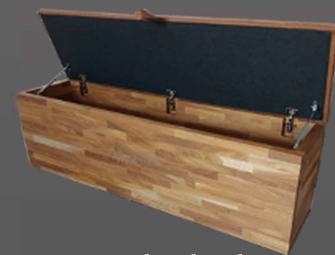
Truhenbank ca. 160x52x40 cm

Wangen: Dekor Schübe: Dekor Griff: Grande