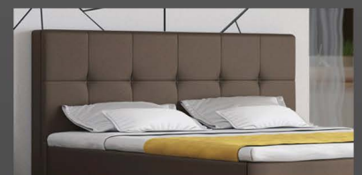
Kopfteil mit Feldern