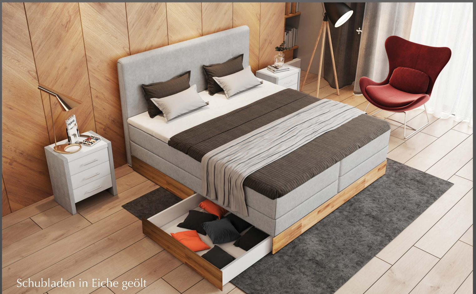
Schubladen in Eiche geölt