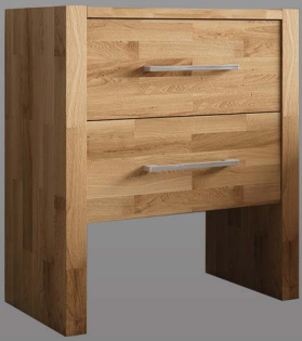
Nachtkonsole Primera mit 2 Schubladen

Wangen: Massivholz Schübe: Massivholz Griff: Grande