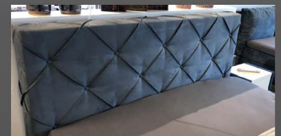
Kopfteil mit Bisen und Knöpfen