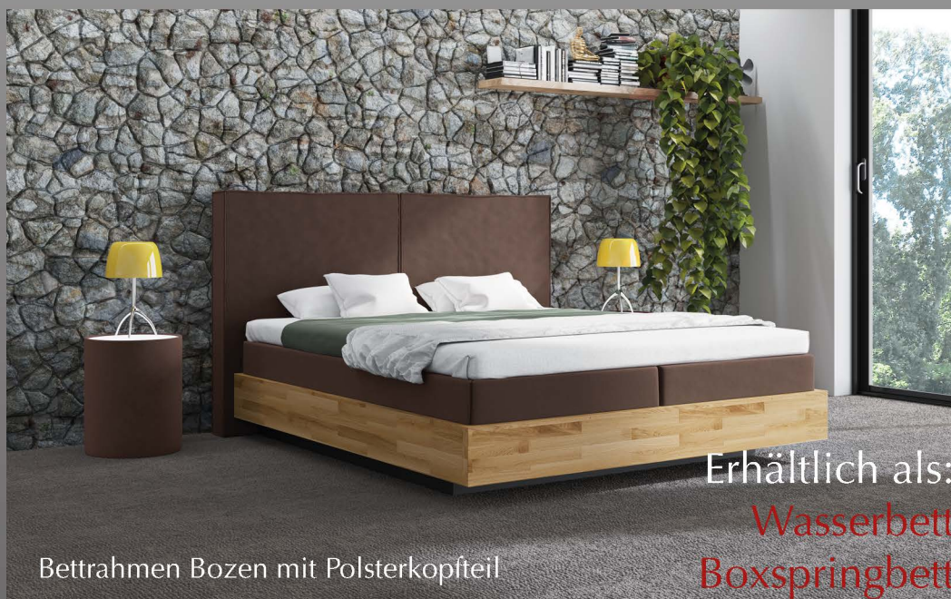
Bettrahmen Bozen mit Polsterkopfteil

Holz strahlt eine natürliche Ruhe aus und wirkt sich positiv auf unser Raumklima sowie unseren Gemütszustand aus. Gönnen Sie sich ein Stück Ruhe und ein besseres Raumklima mit dem Modell Bergen. Genießen Sie einen perfekten Schlaf im Wasserbett oder Boxspringbett