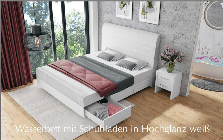
Wasserbett mit Schubladen in Hochglanz weiß

Große Auswahl und individuell gefertigt. Kombinieren Sie aus einer großen Auswahl an Kopfteilen, Boxen, Füßen sowie Farben. Bestimmen Sie Größe, Höhe und Extras ganz nach Ihrem Geschmack.