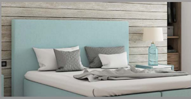
Kopfteil Barcelona Schlichtes Kopfteil in allen Breiten, Höhen und Tiefen