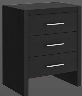
Nachtkonsole Primera mit 3 Schubladen

Wangen: Dekor Schübe: Dekor Griff: Grande