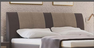
Kopfteil Lüneburg Leicht geschwungenes Kopfteil mit 2 Kissen