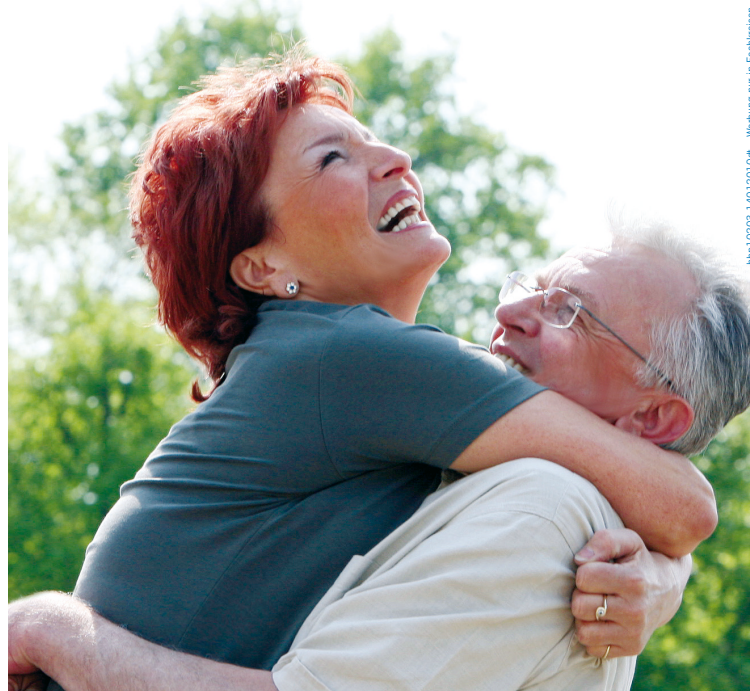
hhp 10203-1-40120104 - Werbung nur in Fachkreisen

Die hhp Massageliege wurde vom Deutschen Olympischen Sportbund getestet und empfohlen.