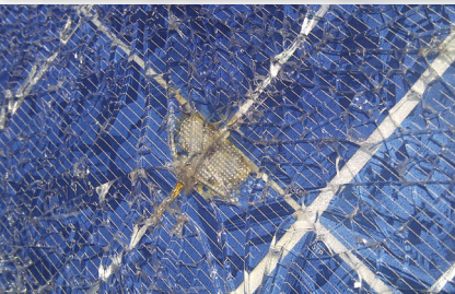
Hotspot und Glasbruch